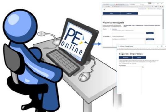
Figuur 1 Presentie via schermen in PE-online

Iedere aanbieder kan dit doen door in te loggen in PE-online en daar de deelnemers toe te voegen. Het is mogelijk de deelnemers op nummer te importeren